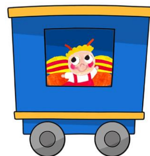
Třída Broučci 4 – 7 leté děti 778 429 328