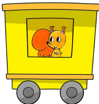
Třída Veverky 3 – 5 leté děti 778 429 327