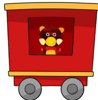
Třída Medvídci 4 – 7 leté děti 778 429 326