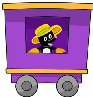
Třída Krtečci 3 – 5 leté děti 778 429 325